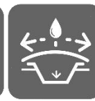
GÉNIE DE L'ENVIRONNEMENT