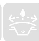
GENIE DE L'ENVIRONNEMENT