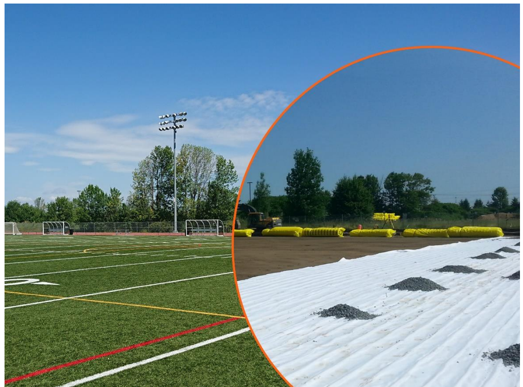
Ste Hyacinthe Qc – Terrain sportif synthétique – 2014

1300, 2 e rue, Parc Industriel Sainte-Marie-de-Beauce (Québec) G6E 1G8 CANADA