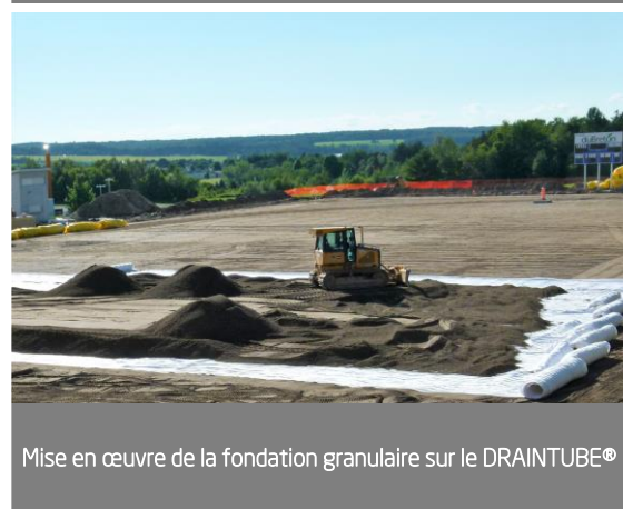
Mise en œuvre de la fondation granulaire sur le DRAINTUBE®