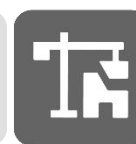
GENIE DU BATIMENT